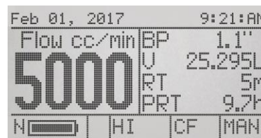
Pantalla de Medición

Las referencias a las pantallas de la bomba y pantallas de menús usan los nombres y etiquetas siguientes: